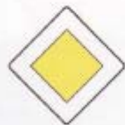
D-1 droga z pierwszeństwem przejazdu