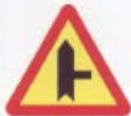
A-6b skrzyżowanie z drogą podporządkowaną występującą po prawej stronie