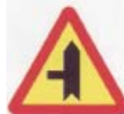
A-6c skrzyżowanie z drogą podporządkowaną występującą po lewej stronie