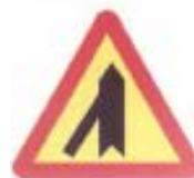
A-6e wlot drogi jednokierunkowej z lewej strony