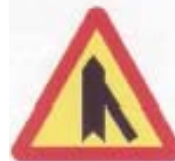
A-6d wlot drogi jednokierunkowej z prawej strony