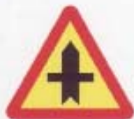
A-6a skrzyżowanie z drogą podporządkowaną występującą po obu stronach